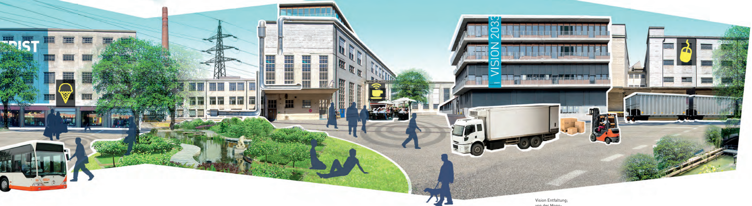
Vision Entfaltung; von der Mono- zur Multinutzung.