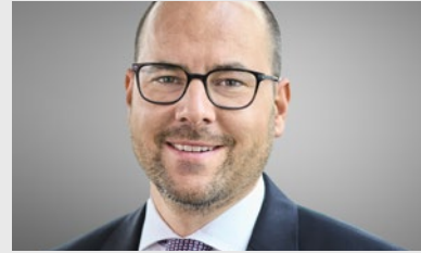
Jérôme Baumann, Präsident des Stiftungsrats Swiss Prime Anlagestiftung